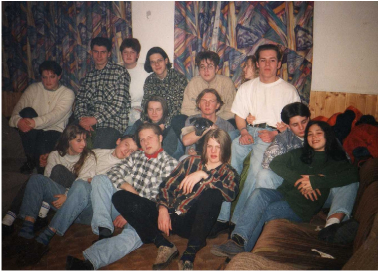
Ratespiel: Wer ist wer? Unsere Quellen waren sich auch nicht sicher...