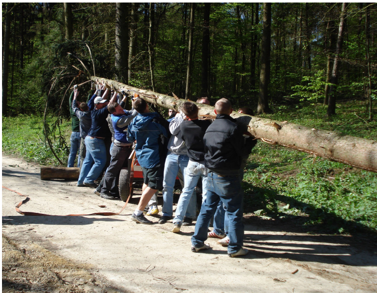
„Hebst auf ihr lahmen Säcke!“ im Raschalaer Wald.