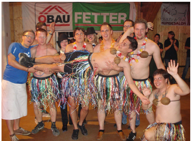
Wer hat die Kokosnuß geklaut? Die Burschen der Jugend missbrauchten sie beim Kirtag 2008 als BH.