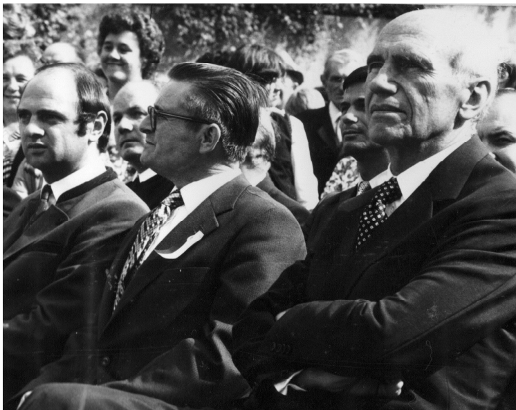
Bei der 750-Jahr-Feier: Bundespräsident Rudolf Kirchschläger, Bürgermeister Alois Hörker und (damals noch Landesrat) Erwin Pröll (v.r.).