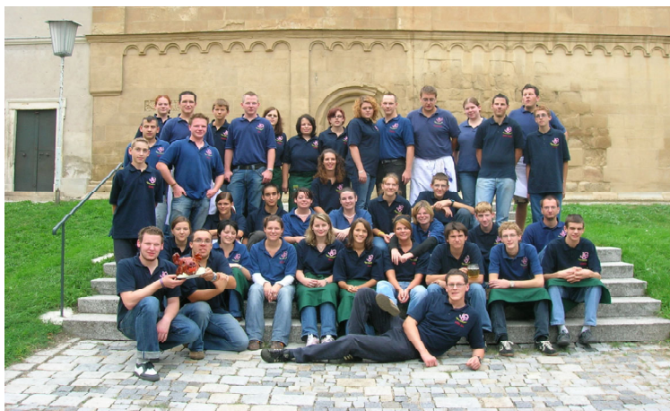
Gruppenfoto mit (fast) allen Mitgliedern beim Kirtag 2006.

Dann bricht aber der Ernst des Vereinslebens an, doch bei aller Ernsthaftigkeit darf der Spaß nicht