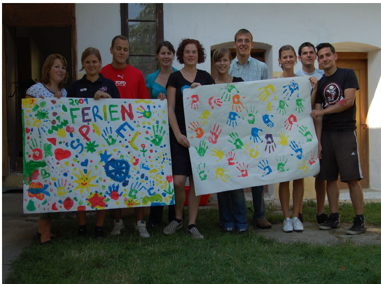
Die Jugend nahm 2009 beim Ferienspiel teil. Ein voller Erfolg, bei dem nicht nur die Kinder ihren Spaß hatten.