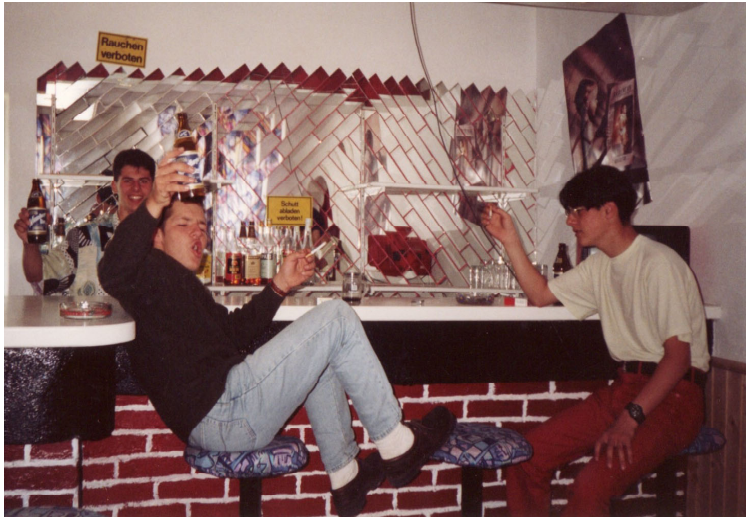
Die Bar war immer schon der beliebteste Ort, auch im alten Jugendheim.