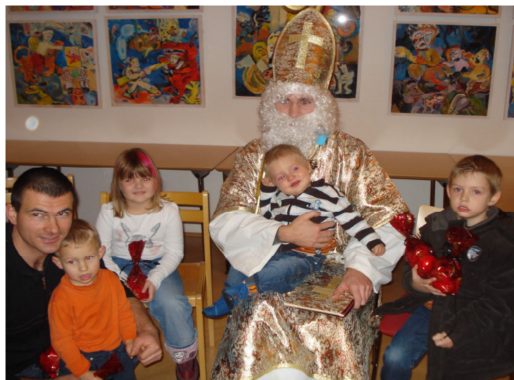
Jährlich lädt die Jugend den Nikolaus ein. Gewöhnlich folgt er der Einladung und bringt Geschenke mit, wie auch 2008.